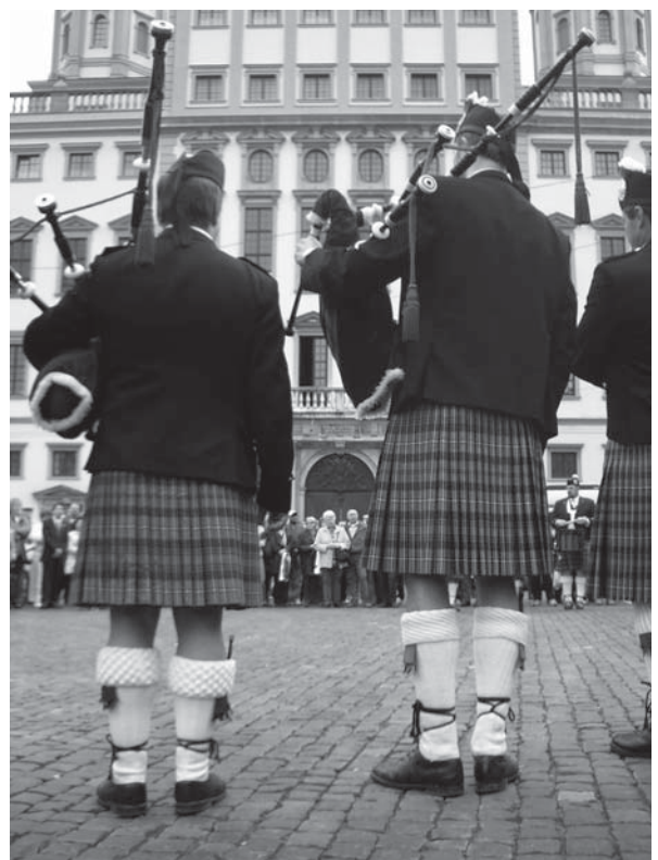
EU-Städtepartnerschaftsförderung: Neben einem folkloristischen Rahmen ist immer stärker die Auseinandersetzung mit europäischen Sachthemen gefragt.

In der jüngsten Antragstranche (Antragsfrist 15. Februar 2010) wurden in der Aktion 1, Maßnahme 1.1 europaweit 249 Projekte ausgewählt, davon 45 aus Deutschland und 13 aus Bayern mit einem Fördervolumen von über 182.000 €. Jedoch erhielt in der Maßnahme 1.2, der thematischen Netzwerkbildung zwischen Partnerstädten keine bayerische Kommune einen Zuschlag. Da die EACEA künftig stärker auf Netzwerke setzt und sie in diesen die Ent-