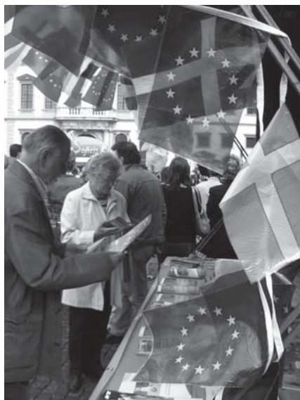
Die EU-Kommission setzt verstärkt auf die Bildung von europäischen Netzwerken zwischen Städtepartnerschaften.

wicklung einer thematischen und langfristigen Zusammenarbeit sieht, sollten bayerische Kommunen diese Maßnahme stärker nutzen, um die Chancen einer EU-Förderung zu erhöhen. Sicherlich ist es aufwendiger, ein größeres Projekt zu beantragen, weil man mehrere Partner zusammenbringen muss, jedoch sind auch höhere Fördervolumina (bis zu 150.000 €) erreichbar und die Netzwerktreffen – mindestens drei – können über einen Zeitraum von bis zu zwei Jahren hinweg verteilt werden. Außerdem – das ist gerade für Gemeinden die nur eine Städtepartnerschaft haben interessant – können auch die Part-